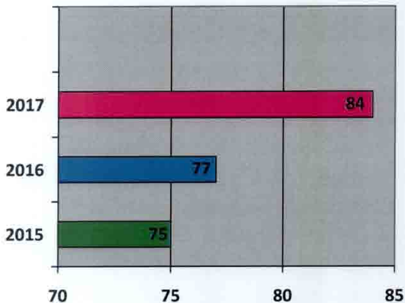
Wykres 2: dzieci w instytucjonalnej pieczy zastępczej w latach 2015-2017

Jak wynika z powyższego wykresu liczba dzieci umieszczanych w placówkach opiekuńczo-wychowawczych ma tendencję wzrostową. Wynika to z dwóch przyczyn: niewystarczająca ilość rodzin zastępczych, wiek dzieci i liczebność rodzeństw.