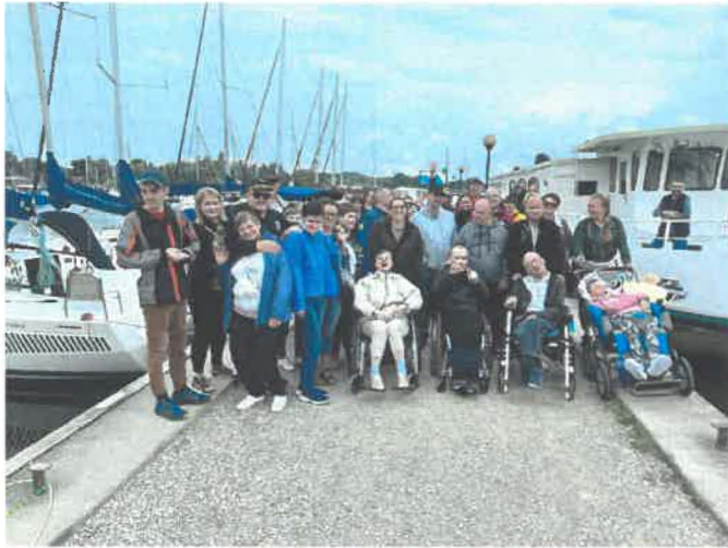
Wycieczka na Mazury