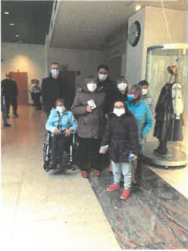
Koncert Zespołu Mazowsze